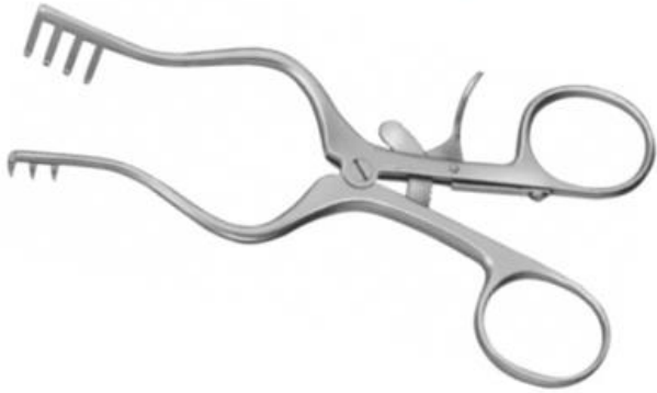
Separador Weitlaner 2x3 13cm