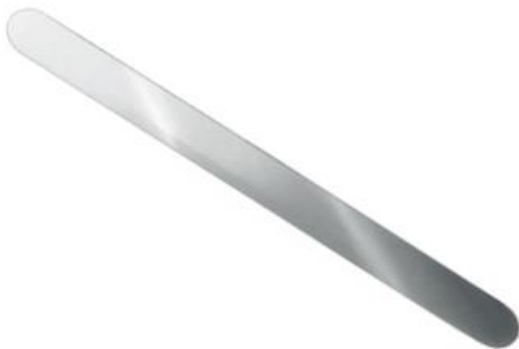
Espátula Maleable 13mm