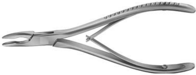
Pinza Gubia Luer Friedman 145 mm