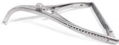
Separador de láminas Inge 16 cm